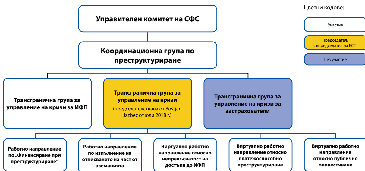
Фигура 2: Управление на СФС в областта на реструктурирането

В рамките на насочената към банките трансгранична група за управление на кризи, ЕСП имаше принос към доклад за прилагането на стандарта за TLAC, публикуван през юли 2019 г., и към текущата работа по определянето на неразпределените ресурси на TLAC. ЕСП участва също така в работни срещи на СФС за установяване на TLAC и обособяване; непрекъснатост на достъпа до ИФП; и ликвидност при реструктурирането, и е активен участник във виртуалните работни потоци, посветени на привеждането в действие на елементите, свързани с изпълнение на отписването на част от вземанията и непрекъснатостта на достъпа до ИФП. Освен това ЕСП допринесе за работата по публичното оповестяване на планирането на реструктуриране и възможността за реструктуриране, както и на платежоспособното реструктуриране на дейността с деривативи и на дейността, несвързана с търговския портфейл, които бяха предмет на обществена консултация през 2019 г. И накрая, в контекста на ежегодната процедура на СФС по оценка на възможността за реструктуриране, през 2019 г. ЕСП изпрати индивидуални писма за БСЗ-Г в обхвата на неговите правомощия, в които представи постигнатия напредък и оставащите предизвикателства пред подобряването на възможността за реструктуриране.