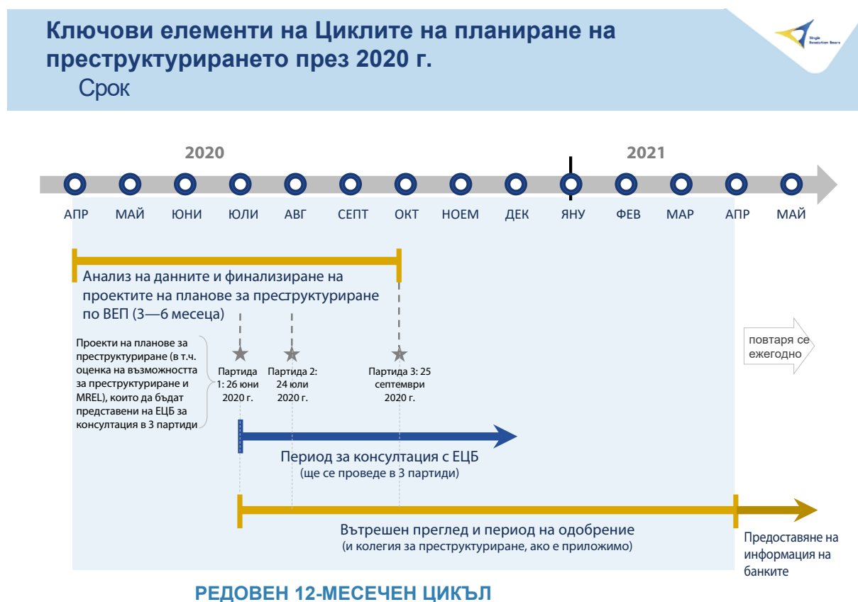
Фигура 1: Съгласуван цикъл на планиране на реструктурирането, започнал през април 2020 г.

За успешното изпълнение на предложения план за цикъла на реструктуриране през 2020 г. са необходими повече усилия за сътрудничество, по-специално в светлината на пандемията от COVID-19, от всички заинтересовани страни, включително и НОП, в резултат на което следва да се постигне устойчива времева рамка за циклите за вземане на решения от 2021 г. нататък.