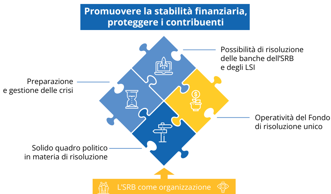
Figura 1. Mandato e aree di lavoro dell'SRB