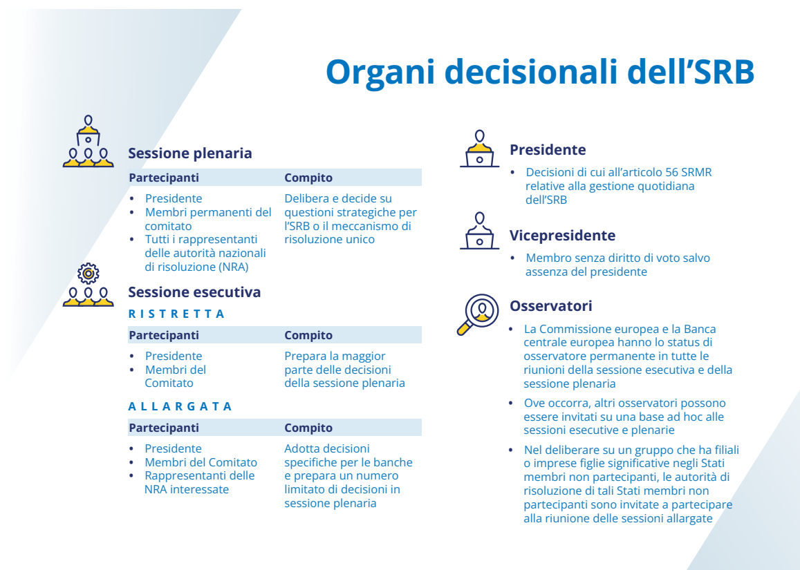
Figura 4. Organi decisionali dell'SRB

La visibilità esterna dell'SRB è aumentata nel corso dell'anno grazie alla divulgazione proattiva in termini di comunicazioni. Sono stati organizzati due importanti eventi: la conferenza giuridica dell'SRB e il seminario congiunto SRB-BCE sul quadro CMDI, che hanno riunito un pubblico proveniente da svariati contesti e hanno promosso interessanti discussioni su tematiche relative alla risoluzione.