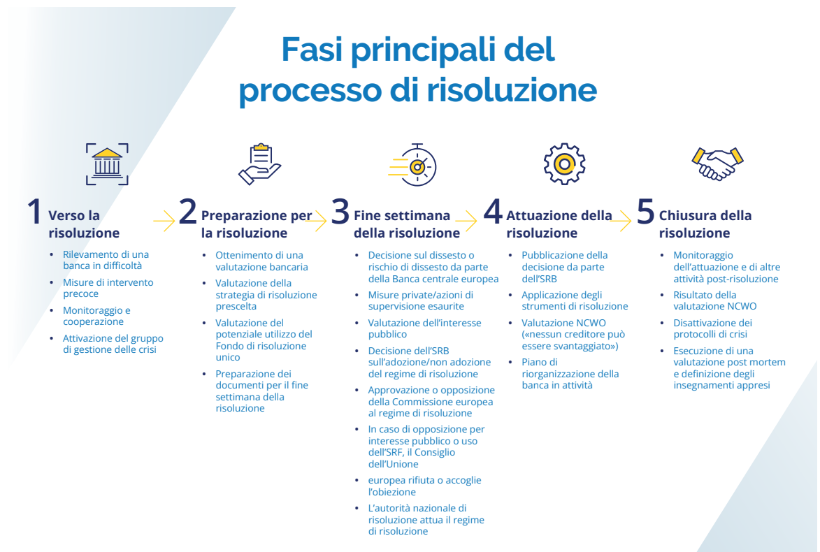
Figura 3. Fasi principali del processo di risoluzione

Nel 2023 l'SRB ha continuato a sviluppare procedure, strumenti, modelli e soluzioni specifiche per le tecnologie dell'informazione e della comunicazione (TIC) in caso di crisi e a migliorare i processi di gestione delle crisi interne ed esterne. Inoltre, ha organizzato esperimenti in condizioni simulate e ha raccolto i principali insegnamenti tratti dalle recenti crisi, come la flessibilità di cui hanno bisogno le autorità di risoluzione nella scelta dello strumento di risoluzione da utilizzare a seconda della situazione.