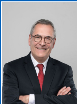
Dominique Laboureix, presidente del Comitato di risoluzione unico

Il 2023 è stato un anno importante per il Comitato di risoluzione unico ( Single Resolution Board, SRB ) e il meccanismo di risoluzione unico ( Single Resolution Mechanism, SRM ), in quanto l'SRB ha raggiunto traguardi fondamentali nella sua breve storia: il Fondo di risoluzione unico ( Single Resolution Fund, SRF ) ha raggiunto il suo livello-obiettivo di 78 miliardi di euro e la maggior parte delle banche di competenza dell'SRB ha soddisfatto i requisiti minimi di fondi propri e passività ammissibili ( Minimum Requirements for own funds and Eligible Liabilities, MREL ). Anche i risultati della valutazione della possibilità di risoluzione relativa al 2023 hanno dimostrato progressi significativi nello sviluppo delle capacità delle banche di sostenere l'efficace esecuzione di un'azione di risoluzione in tutti i settori delle aspettative per le banche ( Expectations for Banks, EfB ).