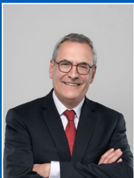
BPV pirmininkas Dominique Laboureix

2023 -ieji Bendrai pertvarkymo valdybai (BPV) ir bendram pertvarkymo mechanizmui (BPeM) buvo reikšmingi metai, nes per savo trumpą istoriją pasiekėme svarbiausius tarpinius tikslus: Bendras pertvarkymo fondas (BPF) pasiekė tikslinį 78 mlrd. EUR lygį, o dauguma BPV kompetencijai priklausančių bankų įvykdė minimalius nuosavų lėšų ir tinkamų įsipareigojimų reikalavimus (MREL). 2023 m. pertvarkymo galimybių vertinimo rezultatai taip pat parodė, kad padaryta didelė pažanga plėtojant bankų pajėgumus remti sėkmingą pertvarkymo veiksmų vykdymą visose lūkesčių bankams (LB) srityse.