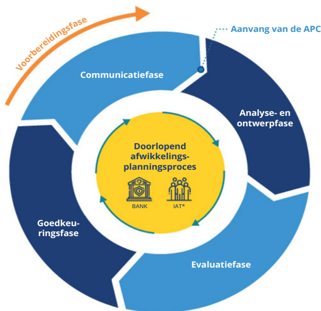
Figuur 2. De afwikkelingsplanningscyclus