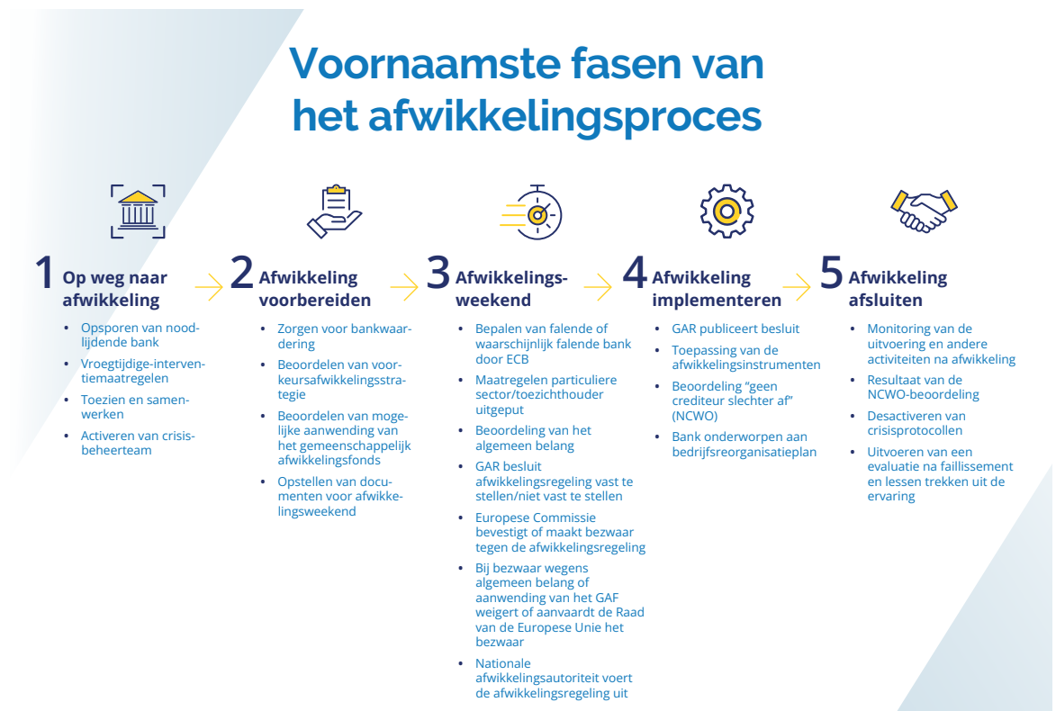
Figuur 3. De voornaamste fasen van het afwikkelingsproces

In 2023 is de GAR doorgegaan met het ontwikkelen van procedures, instrumenten, modellen en specifieke ICT-oplossingen (informatie- en communicatietechnologie) voor crises, alsook met het versterken van interne en externe crisisbeheerprocessen. Daarnaast werden er simulatieoefeningen georganiseerd en essentiële lessen getrokken uit recente crises, bijvoorbeeld omtrent de flexibiliteit die afwikkelingsautoriteiten nodig hebben bij de keuze van het geschikte afwikkelingsinstrument afhankelijk van de situatie.