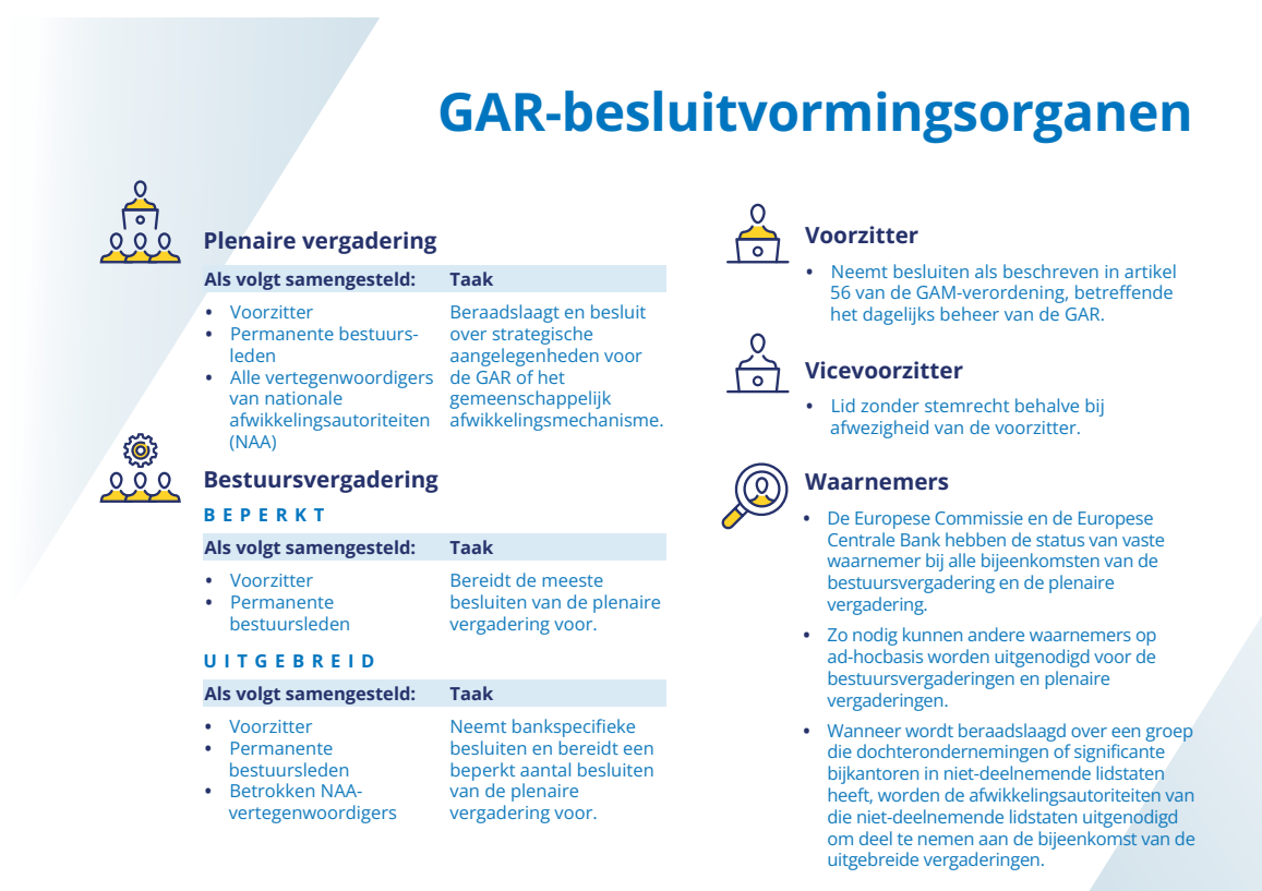
Figuur 4. GAR-besluitvormingsorganen

De zichtbaarheid van buitenaf van de GAR nam het hele jaar toe dankzij proactieve communicatie. Er werden twee grote evenementen georganiseerd: de juridische conferentie van de GAR en het gezamenlijke seminar van de GAR en de ECB over crisisbeheer en depositoverzekering. Deze bijeenkomsten wisten een publiek met zeer uiteenlopende achtergronden aan te trekken en stimuleerden interessante discussies over afwikkelingsgerelateerde onderwerpen.