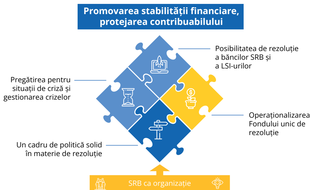
Figura 1. Mandatul și domeniile de activitate ale SRB