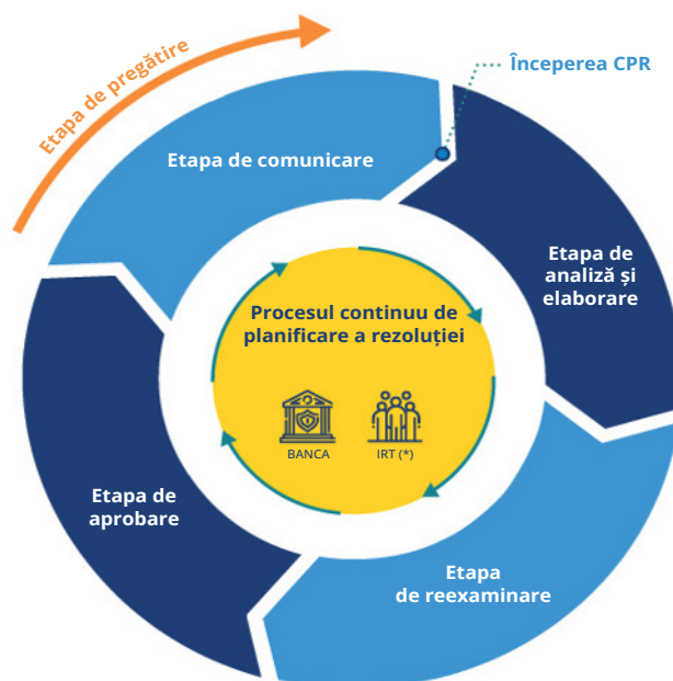
Figura 2. Ciclul de planificare a rezoluției