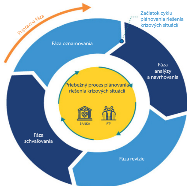
Obrázok 2. Cyklus plánovania riešenia krízových situácií

* Vnútrotný tím pre riešenie krízových situácií.