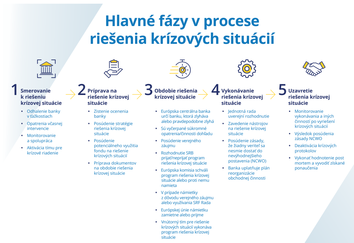
Obrázok 3. Hlavné fázy v procese riešenia krízových situácií

V roku 2023 SRB pokračovala vo vývoji postupov, nástrojov, šablón a špecifických riešení v oblasti informačných a komunikačných technológií (IKT) pre krízové situácie a v zlepšovaní interných a externých procesov krízového riadenia. Okrem toho zorganizovala nácvik situácií a zhromaždila kľúčové ponaučenia z nedávnych kríz, napríklad flexibilitu, ktorú orgány pre riešenie krízových situácií potrebujú pri výbere nástroja na riešenie krízových situácií, ktorý sa má použiť v závislosti od situácie.