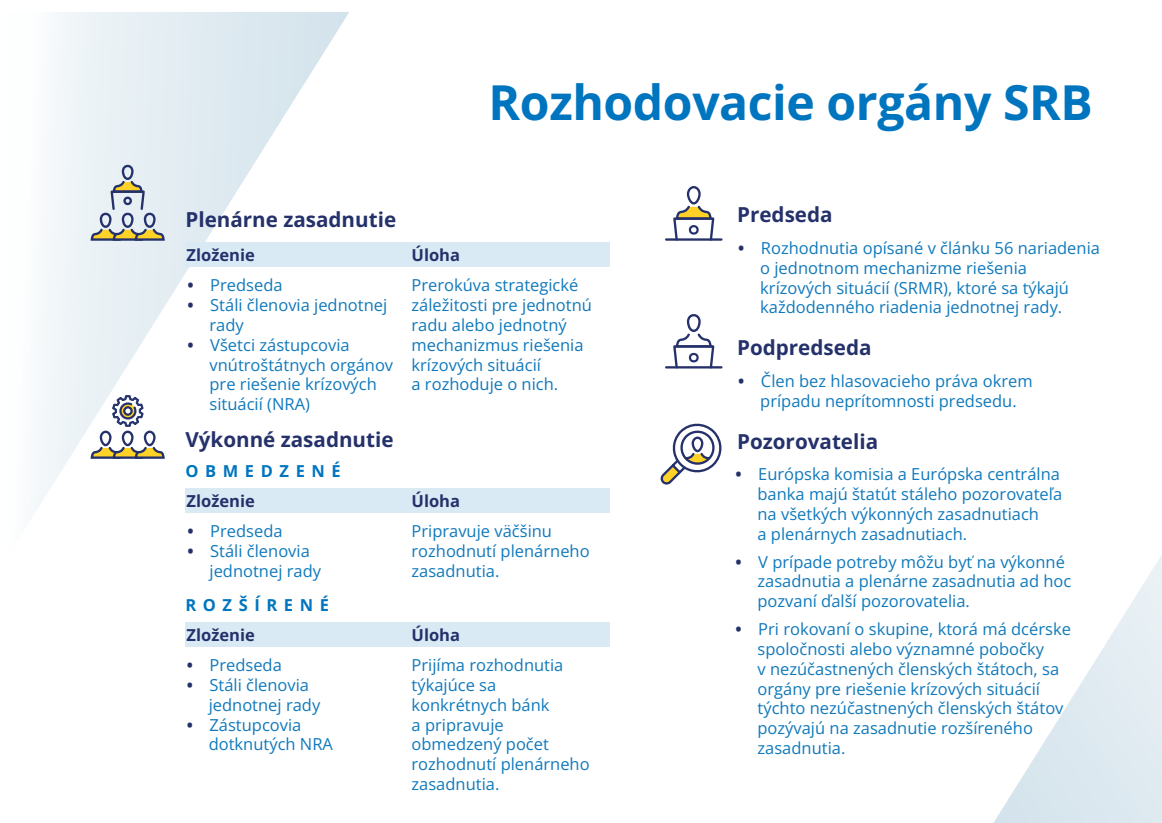
Obrázok 4. Rozhodovacie orgány SRB

Externá viditeľnosť SRB sa počas roka zvýšila vďaka proaktívnemu dosahu v oblasti komunikácie. Zorganizovali sa dve veľké podujatia, právna konferencia SRB a spoločný seminár SRB a ECB o CMDI, v rámci ktorých sa zhromaždilo publikum z najrôznejších prostredí a podporili sa zaujímavé diskusie o témach súvisiacich s riešením krízových situácií.