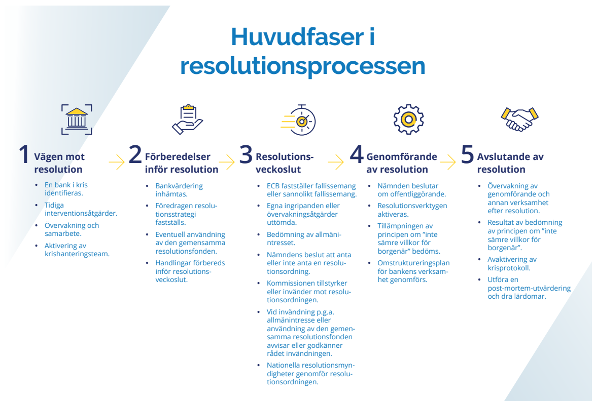
Figur 3 Huvudsakliga faser i resolutionsprocessen

Under 2023 fortsatte nämnden att utveckla förfaranden, verktyg, mallar och specifika lösningar för informations- och kommunikationsteknik (IKT) för kriser och att förbättra interna och externa krishanteringsprocesser. Nämnden organiserade dessutom simuleringsövningar och samlade in viktiga lärdomar från de senaste kriserna, såsom den flexibilitet som resolutionsmyndigheterna behöver när de väljer vilket resolutionsverktyg som ska användas beroende på situationen.