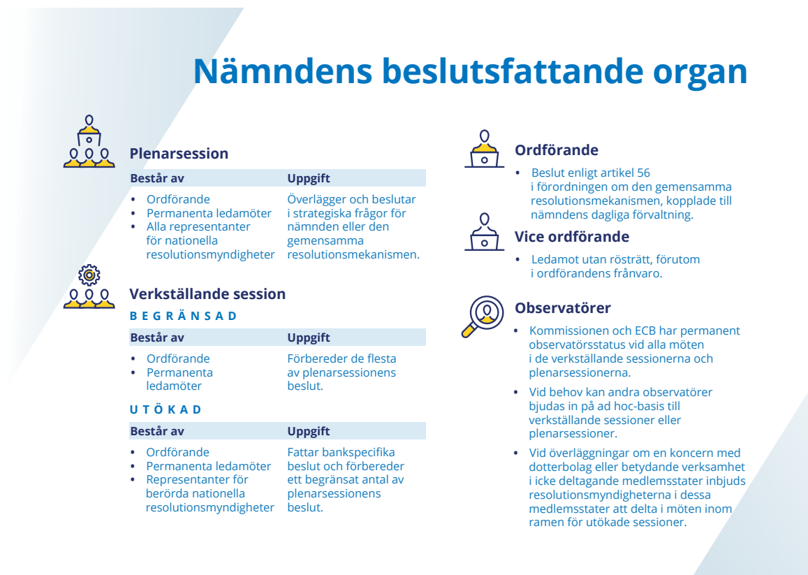
Figur 4 Nämndens beslutsfattande organ

Nämndens externa synlighet ökade under året tack vare den proaktiva utåtriktade kommunikationsverksamheten. Två större evenemang anordnades: nämndens juridiska konferens och nämndens och ECB:s gemensamma seminarium om krishantering och insättningsgaranti. Evenemangen lockade deltagare från många olika bakgrunder och främjade intressanta diskussioner om resolutionsrelaterade frågor.